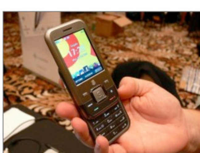
写真2●英INQモバイルの格安携帯「INQ1」 [画像のクリックで拡大表示]

米OQOは7日付けで発表した3G携帯の通信機能を搭載する小型パソコン「OQO model 2+」を公開した（写真3）。幅は5.6インチ（約14.2cm）、重量は1ポンド（約454グラム以下）。5インチのディスプレイには有機ELを採用した。「有機ELのパソコンは世界初」（説明員）という。米クアルコム通信プラットフォームGobiを採用し、CDMA2000 1xEV-DOやHSPAで最大7.2Mビット/秒の通信が可能。出荷は5月になる見通し。