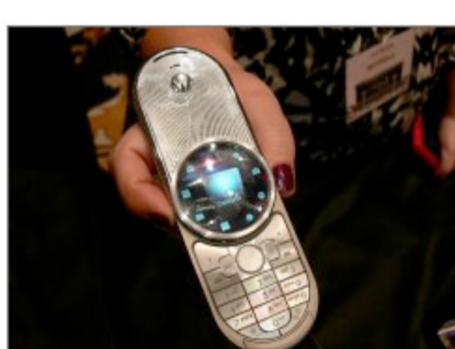
写真1●米モトローラの高級携帯「AURA」 [画像のクリックで拡大表示]

逆に米ドル換算で150ドル（1万5000円）以下という低価格携帯が、英INQモバイルの「INQ1」（写真2）。安くてもネット関連の機能は充実している。Facebook, Skype, Windows Live Messengerのメッセージをやり取りできる。音声通話よりもむしろ、メッセンジャーサービスを重視した設計といえる。英国やオーストラリアで発売になっているほか、3月までには香港で発売を予定する。