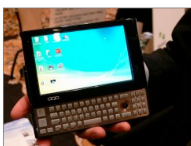
写真3●米OQOの小型パソコン「OQO model 2+」 [画像のクリックで拡大表示]

米クアルコムは、パソコン並みの機能を持つ携帯端末向けプラットフォーム「Snapdragon」の試作機を展示していた。同プラットフォームは1GHzのCPUを核として、3G通信機能などを組み合わせたもの。試作機はノートパソコン型（写真4）のほか、さらに小型の端末を想定した試作品も並んでいた。OSはLinuxのほか、Windows MobileとAndroidが動作していた。