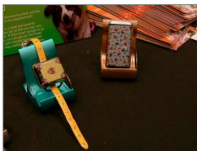
写真6●ペット用（左）や子供用（右）のGPS端末 [画像のクリックで拡大表示]