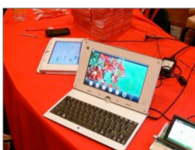
写真4●米クアルコムの「Snapdragon」プラットフォームを採用した試作機 [画像のクリックで拡大表示]